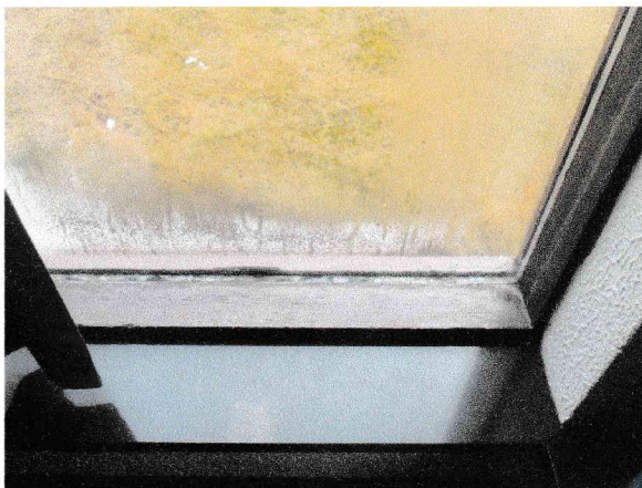
Ónýtt gler í glugga í Súgandisey

Báðar stofurnar eru inn af bókasafni skólans, í suður- og norðurenda bókasafnsins. Í stofunum er tvöfalt gler, ónýtt í nokkrum gluggum, þannig að einangrunargildi þeirra hefur fallið auk þess sem útfellingar myndast við leka milli glerja. Ekki var hægt að merkja mikinn raka í útveggjum nema í norðausturhorni kennslustofu 7. bekkjar.