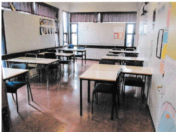
Séð inn í Súgandisey, kennslustofa 9. bekkjar

Hinn 11. apríl s.l. skoðuðu starfsmenn Heilbrigðiseftirlits Vesturlands (HeV) húsakynni Grunnskólans Stykkishólmi að beiðni byggingar- og skipulagsfulltrúa og skólastjóra Grunnskólans vegna kvartana sem borist hefðu frá nemendum um óþægindi og slæma líðan í ákveðnum stofum skólans. Grunur léki á að mygla gæti valdið þessum óþægindum. Tvær kennslustofur voru sérstaklega skoðaðar með myglu í huga, Súgandisey, kennslustofa 9. bekkjar og Arnarey, kennslustofa 7. bekkjar.