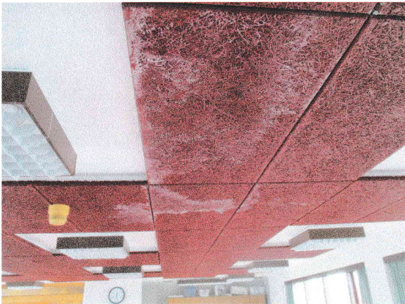
Raki í loftplötum í matsal

Þá bendir HeV á önnur atriði sem þarf að bæta: