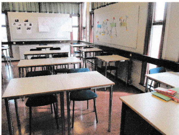
Séð inn í Arnarey, kennslustofu 7. bekkjar

Báðar stofurnar eru inn af bókasafni skólans, í suður- og norðurenda bókasafnsins. Í stofunum er tvöfalt gler, ónýtt í nokkrum gluggum, þannig að einangrunargildi þeirra hefur fallið auk þess sem útfellingar myndast við leka milli glerja. Ekki var hægt að merkja mikinn raka í útveggjum nema í norðausturhorni kennslustofu 7. bekkjar.